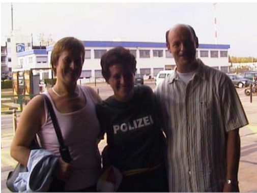
Foto vor dem Rückflug

Sie essen normalerweise zu Haus oder sie gehen zum Biergarten. Zu Haus hat die Mutter gekocht und zwar Rindfleischrolladen mit Knödel, Currywurst, Kartoffelsuppe. Eines Abends haben wir auf einem Biergarten gegessen und ich habe Bratwurst probiert und zum trinken hatte ich die Berliner Weiße. Die ist ein Berliner Bier mit Himbeere-Sirup. Sie haben mir immer gefragt, ob alles gut mit dem Zimmer und mit dem Essen war. Als wir zurückgefliegen sind, war ich sehr traurig, weil ich mich bei ihnen wie zu Haus gefühlt habe. Und ich habe mich sehr gefreut, dass der Vater, als wir in Terravision Bus waren, angerufen hat. Er wollte wissen, ob es alles gut mit dem Flug war. Jetzt erinnere ich mich noch gerne an sie und ich hoffe, dass ich sie bald wieder sehen werde.