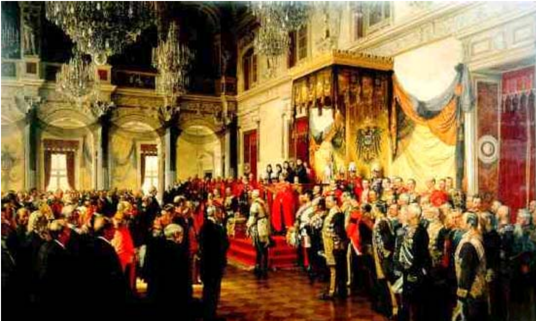
Eröffnung des Reichstages in weissen Saal des Berliner Schlosses durch Wilhelm II.

auf. Eine Mischung von Reform und Blockade kennzeichnete die innenpolitische Situation vor 1914.