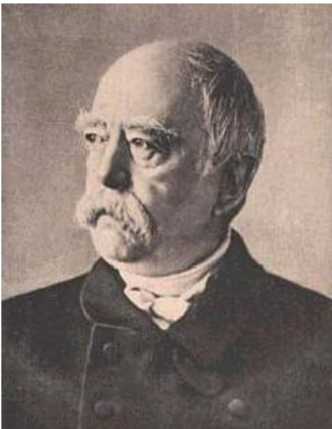
Otto von Bismarck

Das Deutsche Reich entstand 1871 als konstitutionell-monarchischer Bundesstaat unter der Hegemonie Preussens. Staatsoberhaupt war der preussische König als Deutscher Kaiser. Bismarck versuchte als Reichskanzler, die Stellung des Reiches durch eine europäische Bündnispolitik zu sichern. Innenpolitisch strebte er an, das neue Reich durch eine autoritäre Staatsführung unter Wahrung des gesellschaftlichen Gleichgewichtes zu festigen.